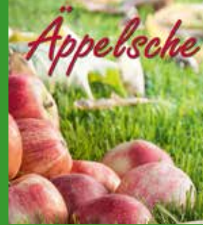
Ferienwohnung Äppelsche für bis zu 6 Personen