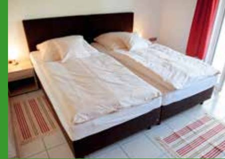
Schlafzimmer mit Loggia